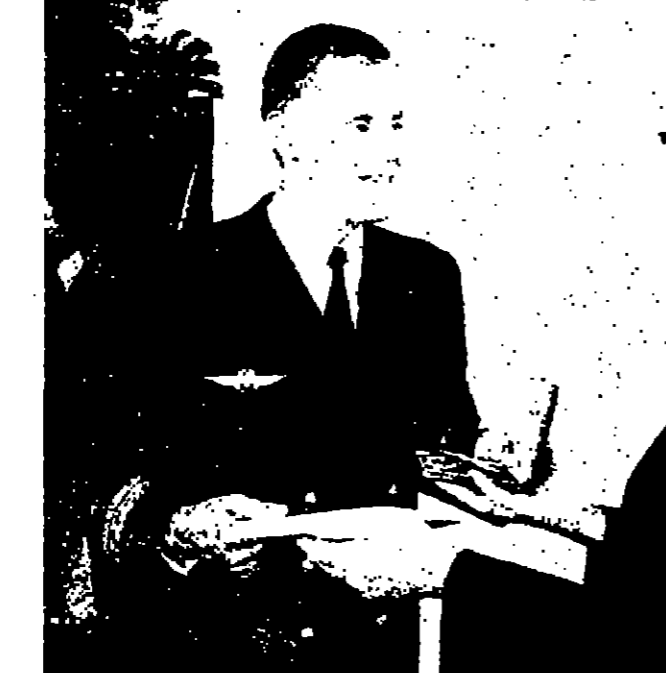
يون - تسلم الفريق هينرش جون بل فترة وجيزة من الزمن من السيد ايرنست بندا وزير الداخلية الالمانية المورة القضية ، وهي اثنان جسدتهما المانيا الاتحادية لحد الرياضيين الالان .

بلكول «انكلترا» - رويتر - تمرد حزب العمال الحاكم في بريطانيا امس ضد سياسة الحكومة القليلة بتزويد نيجيريا بالاسلحة .